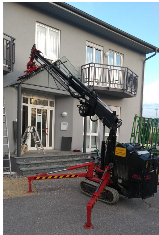
Glasboy 380 600 kg-Sauger